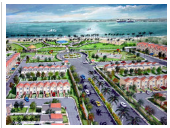
Fig. nº 6. Source: Project: Cámara de la Construcción del Zulia: 50 años de funcionamiento (1954-2004)