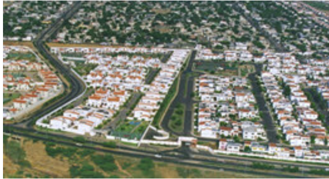
Fig. nº 2. Source: Project The Modern Architectonic and Urban Maracaibo Database (1950-2000)