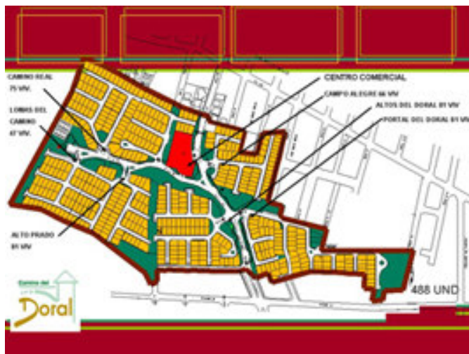
Fig. nº 4. Source: Project: Cámara de la Construcción del Zulia: 50 años de funcionamiento (1954-2004)