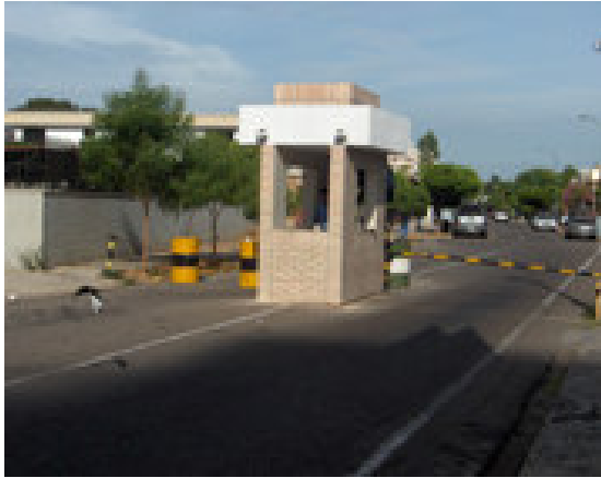
Fig. nº 7.